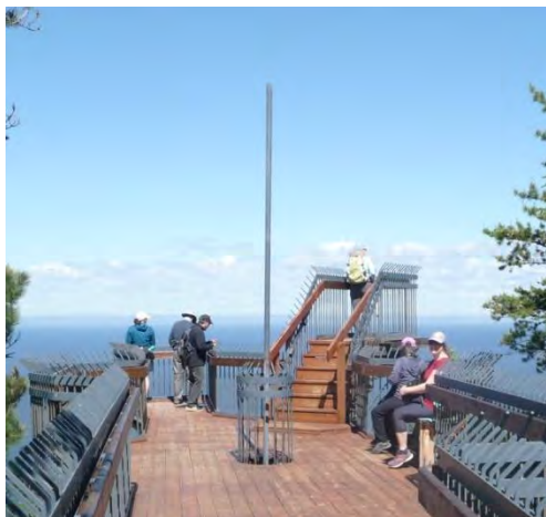
Le belvédère Beaulieu

Par un beau samedi matin, nous étions huit randonneurs à s'être donnés rendez-vous au sentier du Porc-Pic, à Saint-Simon.