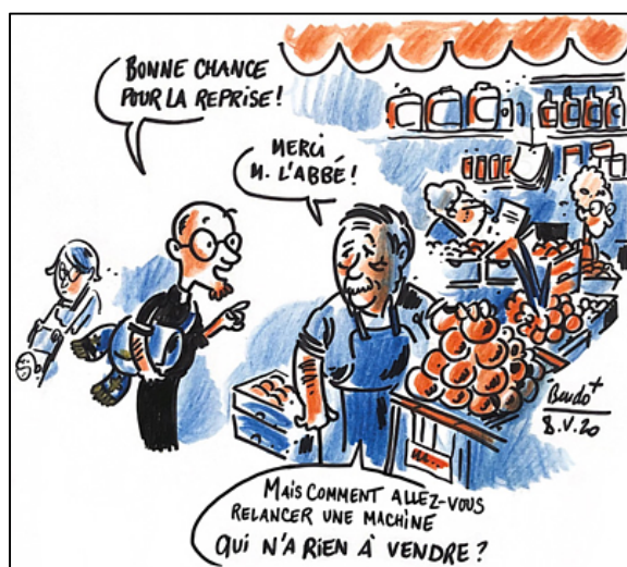
Bendo, Présence , 8 mai 2020