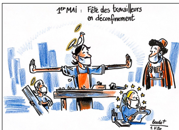
Bendo, Présence , 1 er mai 2020