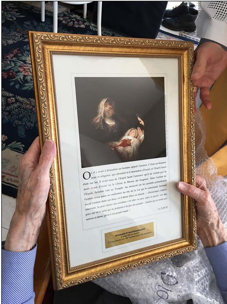
Le Cantique de Syméon, Luc 2, 25-32