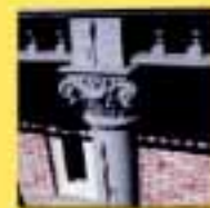
Un pilastre fissuré...

Afin d'assurer la conservation de l'édifice, un plan d'action en trois phases a été élaboré :