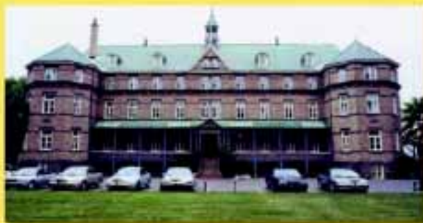
L'Archevêché de Rimouski en 2003

La toiture, qui date de 1957, demande des travaux impératifs si l'on veut empêcher les infiltrations d'eau. La maçonnerie, plus que centenaire, présente des marques d'effritement et demande à être refaite en partie. D'autres travaux s'avèrent également impérieux : travaux de menuiserie, de peinture et d'aménagement en vue de rendre l'édifice plus sécuritaire.