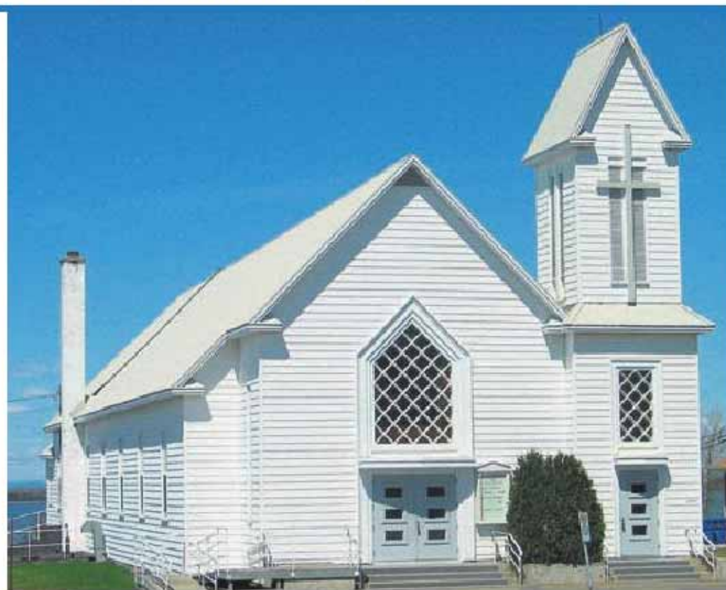
L'église de Nazareth sera bientôt reconvertie en édifice à logements.

Finalement, le conseil municipal appuie le projet d'implanter une pouponnière de 10 places au CPE Les Trois Coins, pour desservir les familles de Sainte-Blandine/Mont-Lebel et répondre aux besoins grandissants de ce quartier.