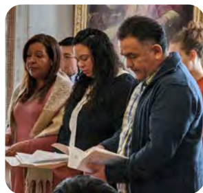
Photo prise lors de l'appel décisif Le 15 mars 2020