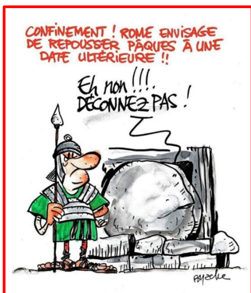
Jean-Marie Byache, 20 mars 2020 (Facebook)