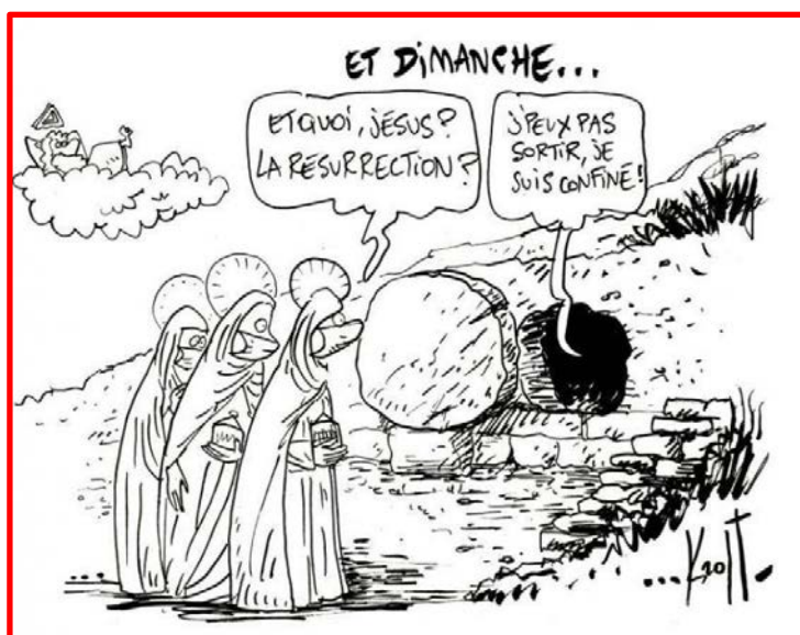
Pierre Kroll, Le Soir (Belgique), 11 avril 2020