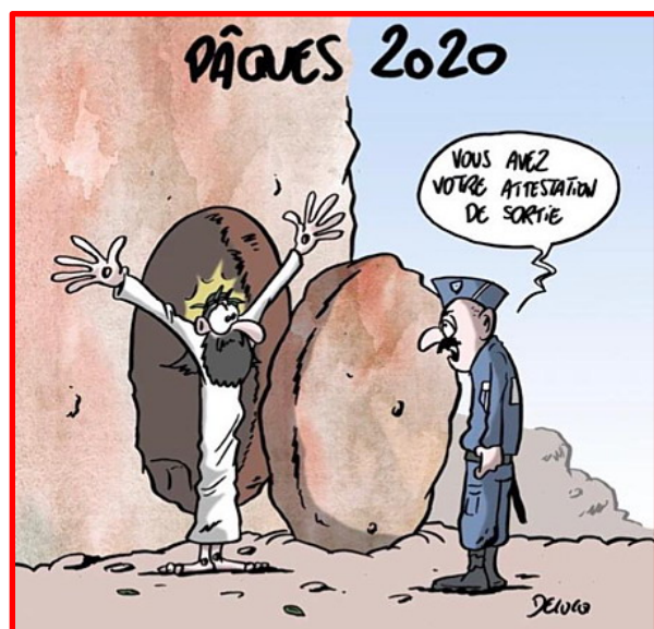
Xavier Delucq, 10 avril 2020 (Facebook/Twitter)