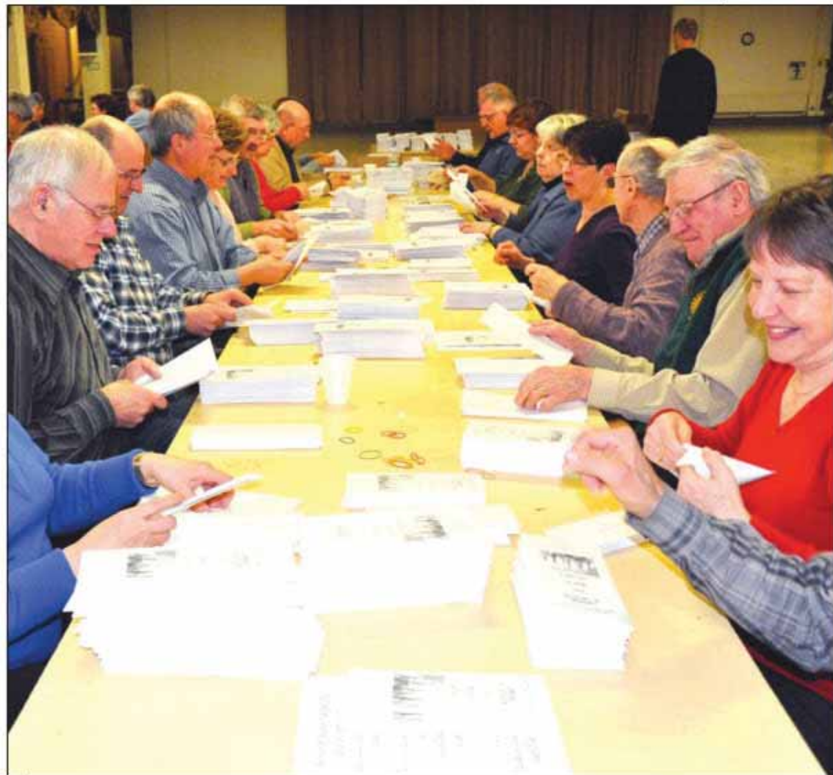
Des bénévoles ont travaillé dur pour préparer les envois.

La capitation de 2010 a dépassé de 25 000 $ la totalité des capitations de 2009. L'argent recueilli sert au fonctionnement des églises, et à répondre aux divers besoins de la Fabrique. La capitation représente 26 % des revenus de la Fabrique sur un budget de 997 600 $ en 2010. La balance provient des quêtes du dimanche, des locations de salles, des funérailles (20 %) et des mariages.